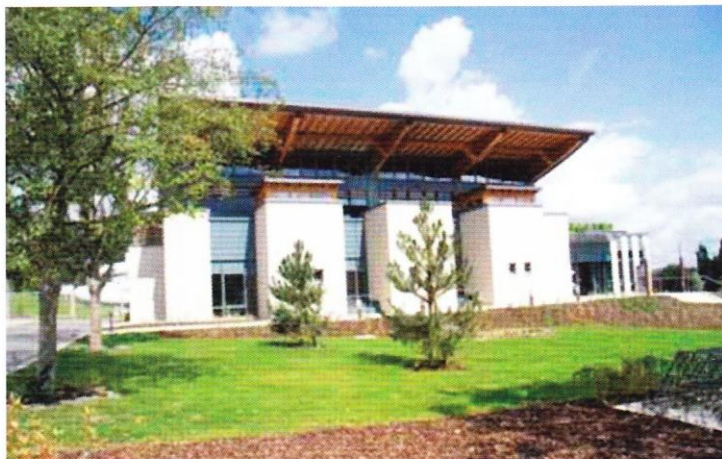
Le Centre Aquatique de Mersch

IMMEUBLE « LES TERRASSES DE L'EUROPE » 6, rue Jean Engling L-1466 Luxembourg Tél.: +352 26 09 42 87